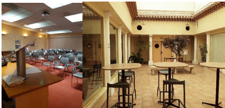
Centre de Référence Maladies Rares Maladies Rares Orales et Dentaires - O-RARES