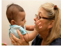
Viens à ma rencontre