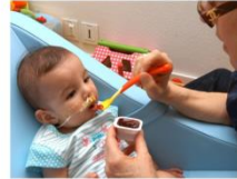
Fais-moi goûter quelque chose