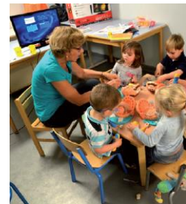
Atelier avec des enfants de 3 ans pour apprendre à brosser les dents