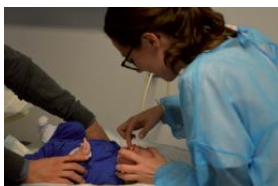
Séance d'éducation avec les parents d'un bébé de 2 semaines

Le programme d'ETP se déroule ensuite au cours de séances individuelles et collectives pendant le séjour de soins (hospitalisation complète ou de jour) et en ambulatoire avec des séances avec le chirurgien, des séances avec le pédodontiste et l'orthodontiste spécialisé, des séances d'hygiène bucco-dentaire, une guidance orthophonique, des consultations avec des infirmières spécifiques d'éducation aux soins.